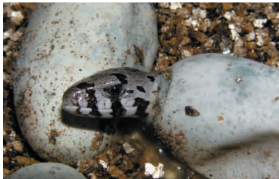
Líhnutí mláďete blavora žlutého

Terárium se neustále vyvíjí a vylepšuje. Prošlo si již řadou změn, exteriérových i interiérových. Dochází ke změnám ve vybavenosti