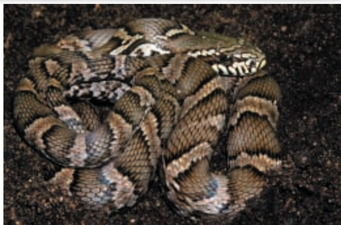
Mládě užovky amurské

V letošním roce se nám opětovně podařilo rozmnožit užovku