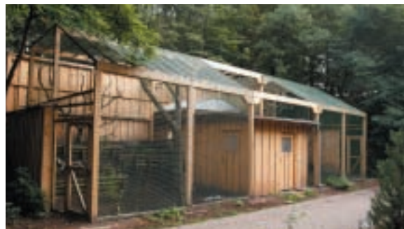
Nová voliéra pro evropské sovy

Dokončená voliéra pro evropské sovy se dočká svých nových obyvatel. Obsadí ji například nově sestavený pár sovic sněžných a další druhy malých sov.