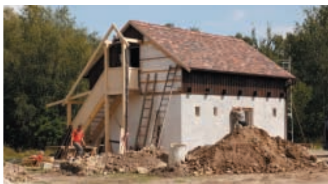
Stavba špejcharu ve Staré Vsi