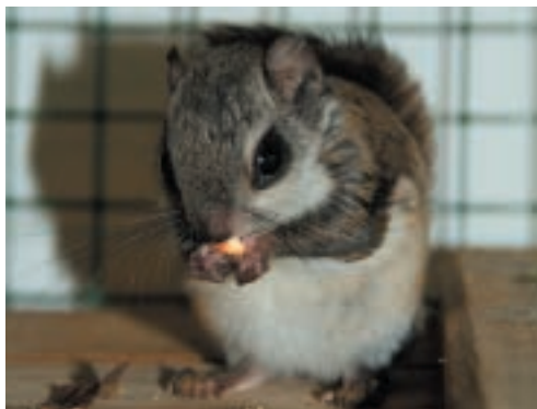
Poletuška slovanská

Do Podkrušnohorského zooparku bylo k doplnění chovu dovezeno z lotyšské ZOO Riga sedm poletušek slovanských. Tento malý hlodavec získal své jméno díky osrstěným blánám, pomocí kterých plachtí ze stromu na strom. Ve volné přírodě žije ve Skandinávii a na Sibiři, v zooparku si poletušky můžete prohlédnout v noktuáriu.