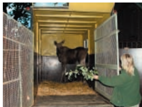
Los evropský při vykládání v zooparku