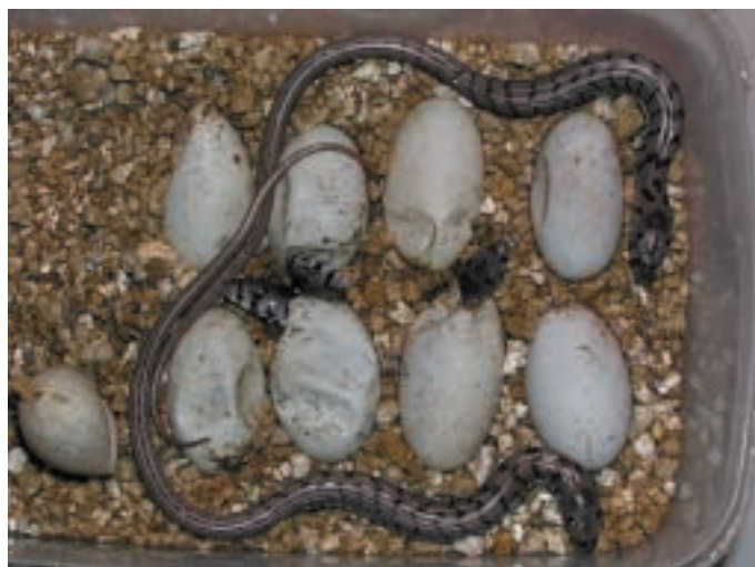
Líhnutí mláďat blavora žlutého

Významným úspěchem bylo i vylíhnutí 7 mláďat želvy