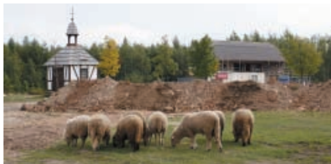
Stavba inženýrských sítí a roubenky