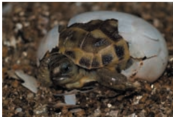
Líhnutí želvy stepní - čtyřprsté