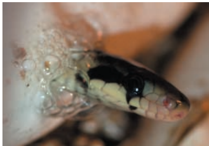
Líhnutí mláďete užovky stromové

terárií. Terária jsou postupně vybavována vhodnějšími umělými zdroji světla (vyzařujícími potřebné UV záření). A to z jediného prostého důvodu, aby poskytovalo chovaným druhům lepší, bezpečnější a zdravější prostředí a návštěvníkům příjemnější pocit z prohlídky terárií.