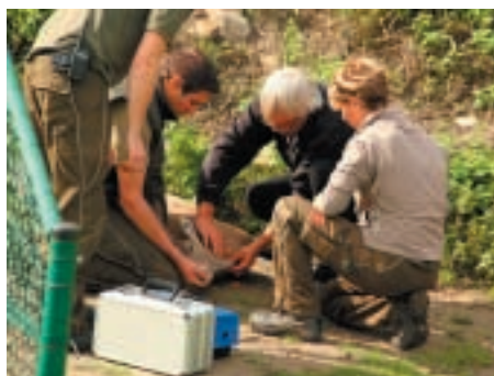
Nakládání kozorožce alpského v Zoo Dierenrijk v Holandsku

Všechna zvířata doplní chov jednotlivých druhů a návštěvníci je již brzy uvidí v expozicích.