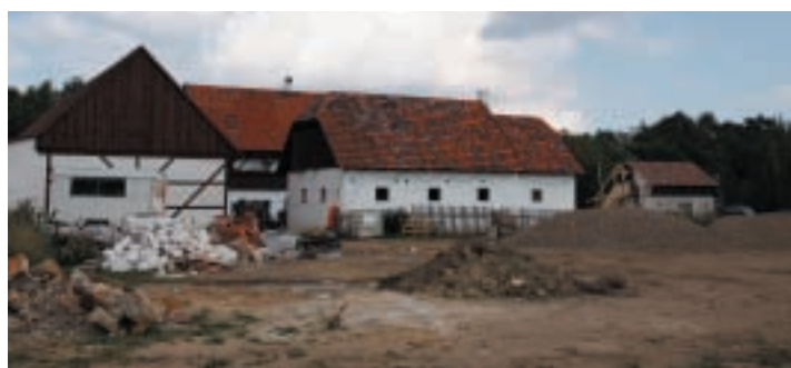
Stavba stodoly za statkem ve Staré Vsi, foto: archiv PZOO

Projekt, jehož cílem je přiblížit život a práci našich předků v oblastech Krušnohoří a zároveň podpořit přeshraniční spolupráci mezi Českou republikou a Svobodným státem Sasko, spadá do programu Cíl 3. Tento program je financován Evropským fondem pro regionální rozvoj ERDF. Projekt podporuje Ministerstvo pro místní rozvoj.