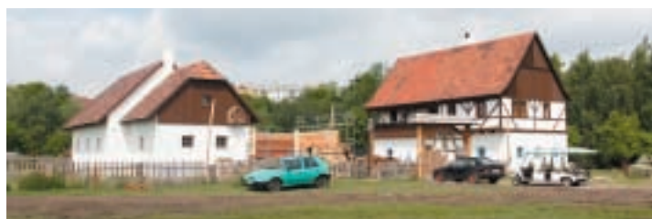
Stavba stodoly za statkem ve Staré Vsi, foto: archiv PZOO