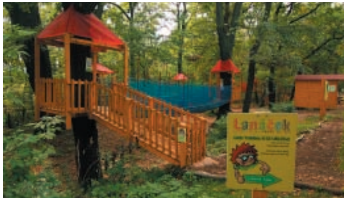
Lanové centrum Lanáček

Lanové centrum Lanáček je soustavou 10-ti různorodých drah, na nichž si mohou děti od 3 do 11-ti let vyzkoušet svou fyzickou zdatnost. Dráhy jsou samozřejmě řešeny s ohledem na bezpečnost dětí a po celý den na provoz dohlíží zodpovědný pracovník. O prázdninách je lanáček otevřen denně od 9:00 hodin do 18:00 hodin. Vstupné je 50,- Kč na den. Po zaplacení vstupného dostanou děti na ruku označující náramek, a proto je možné navštívit Lanáček v rámci padesátikorunového vstupného opakovaně v průběhu dne.