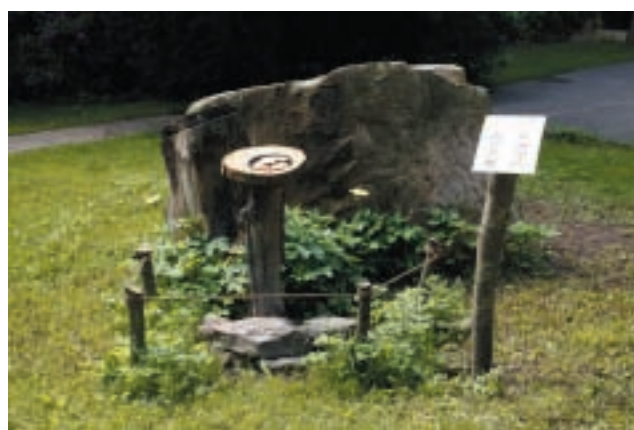
Motýlí krmítko před správní budovou

Většinu motýlů potkáte na nejrůznějších kvetoucích rostlinách a keřích. Motýly je zde nejvíce vyhledáván tzv. tibetský šefík, kterému se také někdy říká „motýlí keř“. V zooparku jej můžete vidět před vchodem do výstavní síně, kde je také umístěno krmítko. Některé druhy, jako například bělopásci a batolci, naletují dokonce na čerstvý trus, nebo mrtvolky zvířat. Aby bylo možné motýly lépe pozorovat byla vytvořena tzv. motýlí krmítka. Jsou to například umělé květy se sladkou šťávou, nebo misky s nejrůznějšími lákadly jako jsou přezrálé ovoce, nebo trus. Krmítka samozřejmě přilákají i jiné zástupce hmyzí říše a tak můžete při hodování pozorovat mouchy, vosy a dokonce i sršně. Stačí se jen zastavit a vyčkat přilet některého z hmyzích druhů.