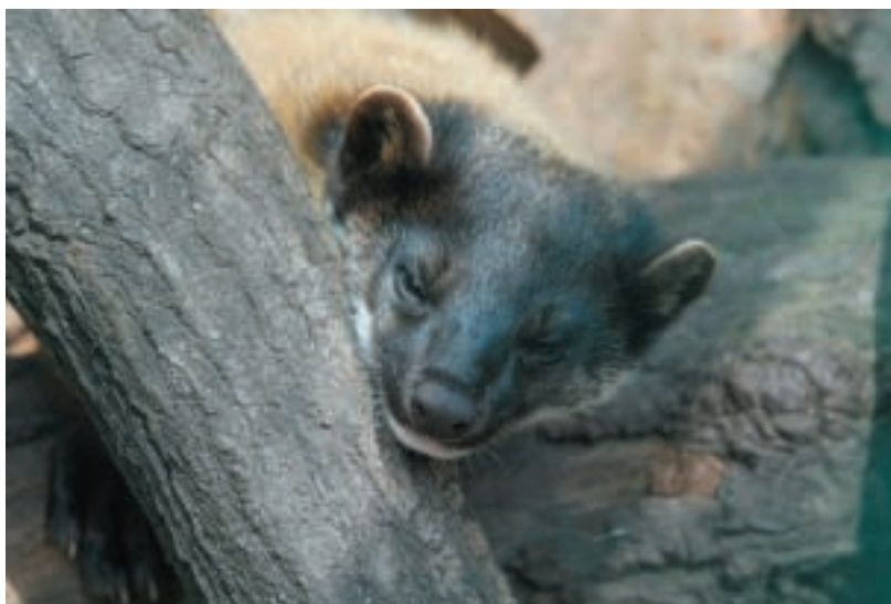
Charza žlutohrdlá

Slavnostní večer byl zakončen neformálním setkáním chovatelů, kde nechyběl raut.