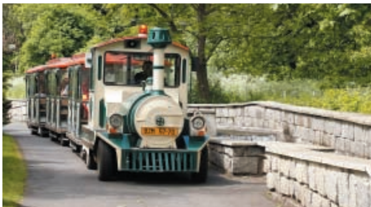
Lokálka Amálka