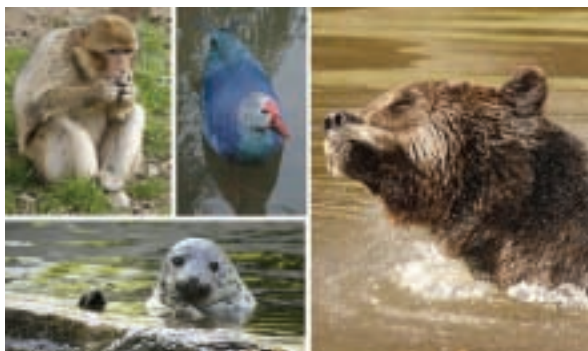
Makak magot, slípka modrá, medvěd hnědý, tuleň kuželozubý