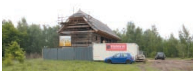
Stavba roubenky ve Staré Vsi

Stavební práce ve Staré Vsi probíhají v současné době v režii stavební firmy Proxima, a. s.. Stavby stodoly, špejcharu, roubenky i oplocení rozsáhlého areálu zaznamenávají viditelný pokrok. Projekt, jehož cílem je přiblížit život a práci našich předků v oblastech Krušnohoří a zároveň podpořit přeshraniční spolupráci mezi Českou republikou a Svobodným státem Sasko, spadá do programu Cíl 3. Tento program je financován Evropským fondem pro regionální rozvoj ERDF. Projekt podporuje Ministerstvo pro místní rozvoj.