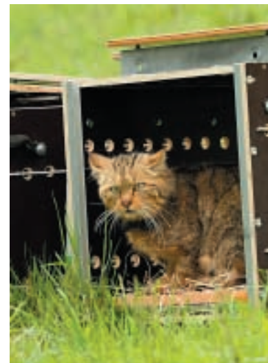
Kočka divoká, foto: M. Brtnický

Výběr lokalit provedli pracovníci správy NP Velká Fatra ve spolupráci s lesníky. Byly vybrány lokality, kde již kočky žijí, nebo zde v minulosti byly pozorovány. Jsou to lokality s rozsáhlými lesními porosty, kde kočky najdou vhodné úkryty a také dostatek potravy. Tato místa musí být co nejvíce vzdálena od civilizace aby se omezil kontakt s lidmi. Dobrou zprávou je, že slovenští lesníci, myslivci ani strážci národního parku nenašli za poslední roky žádnou uhynulou kočku. A tak budeme věřit, že se naše úsilí vyplatí a kočky odchované v zoo se budou ve volné přírodě úspěšně rozmnožovat.