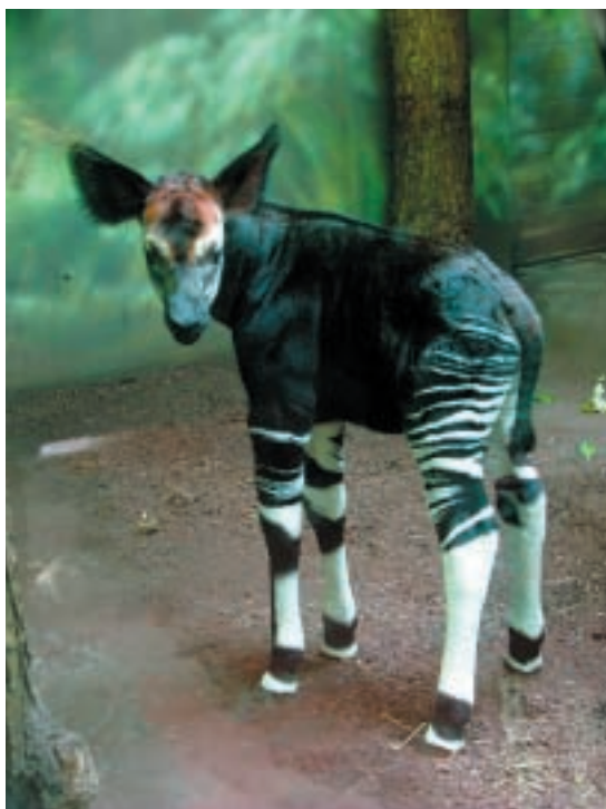
Okapi