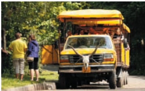
Safari expres

O prázdninách můžete také využít VEČERNÍ JÍZDY SAFARI EXPRESEM a to každý pátek a sobotu ve 20:30 hodin. Stanoviště pro večerní jízdy se nachází před vjezdem do zooparku ze směru od Kamencového jezera.