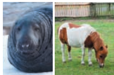
Pony Shetlandský, foto: R. Stach

Ve volné přírodě je délka života ovlivněna řadou ohrožujících faktorů, které v zajetí neexistují. Například dostatečný příjem vyvážené stravy, veterinární péče a absence stresu mají na dlouhověkosti zvířat podstatný podíl.